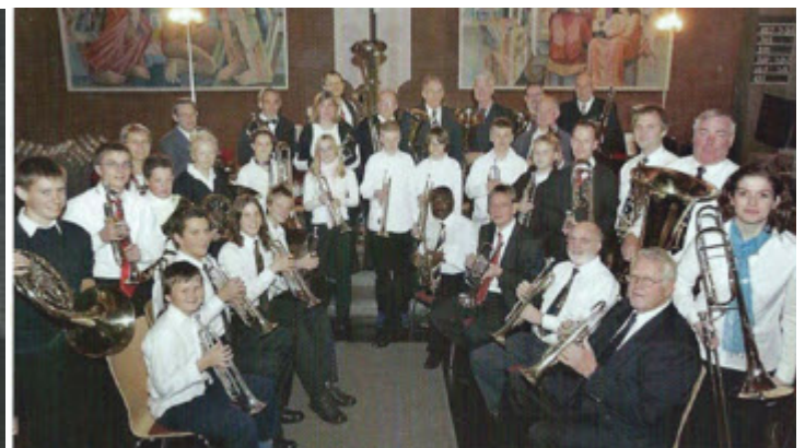
Konzert November 2006