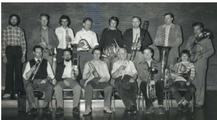
Probe zum 80-jährigen Jubiläum 1978

Sonntag, 11. November, 16.00 Uhr: Konzert „120 Jahre Posaunenchor Sudbrack“ in der Matthäuskirche.